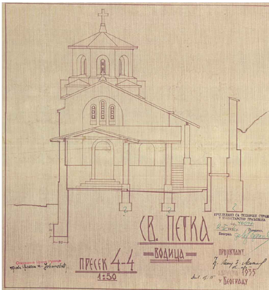
Сл. 11. Момир Коруновић, пресек западне фасаде Храма Св. Петке (1935) у Београду (пројекат потписао арх. Леонид З. Макшејев)

примарног ауторства, која се може разрешити позивањем на морални кодекс архитектата, закључке судова части и закон о ауторским правима (АНОНИМ 1968; МАРИЋ 2005; ВАКИЋ 2006). Уз то, историографима ће велики проблем стварати савремено укрупњавање ауторских тимова, због чега ће бити веома тешко идентификовати главног