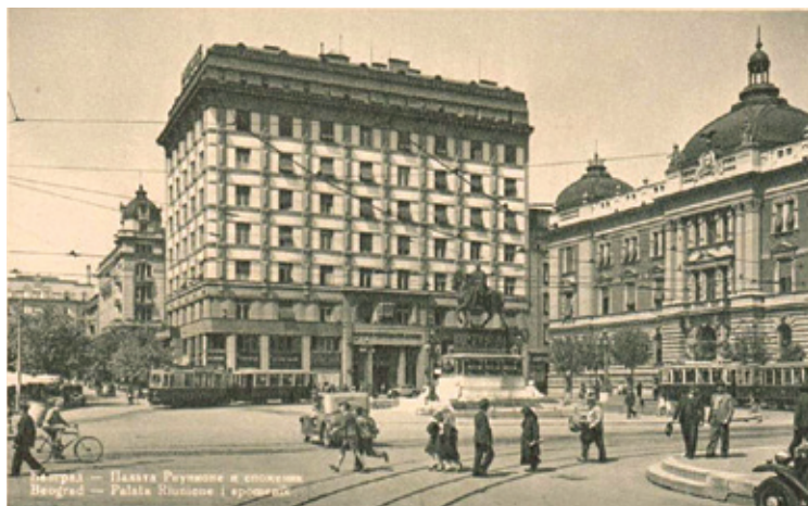
Сл. 8. Иван Белић, Палата „Реунионе” (1931), Београд (разгледница)